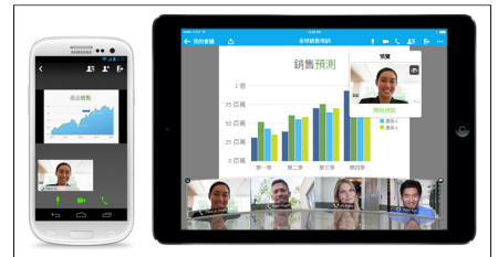
圖 3. 使用任何裝置參加會議

WebEx Meeting Center 會定期更新，以符合最新的系統兼容需求。若想查看系統需求，請造訪 www.webex.com.hk 。