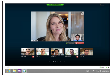
圖 2. 全螢幕模式檢視

WebEx Video Bridge 可讓其他人更輕易地加入您的個人會議室。大家都可使用任何標準視訊裝置來加入您的會議。